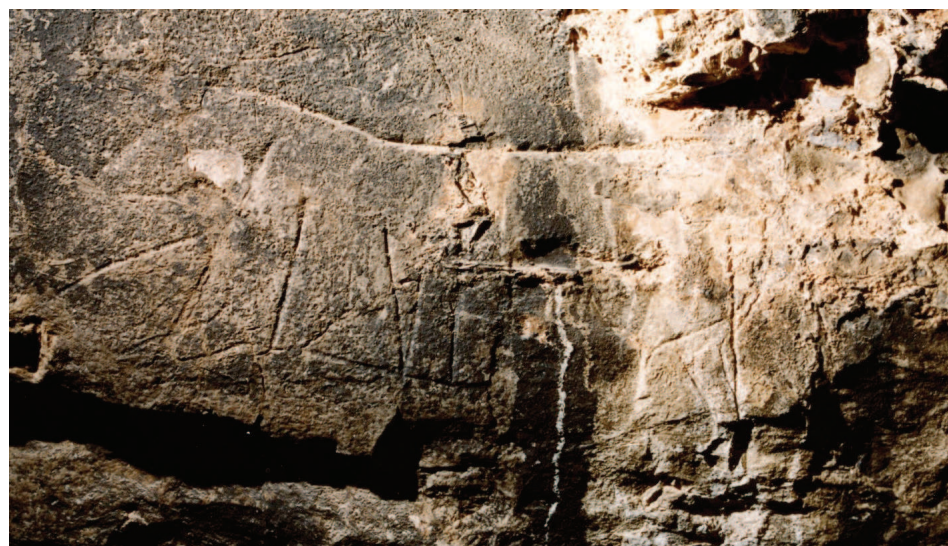
Fig. 1 Grotta della Zà Minica, Torretta (PA), figura di bovide

Nel 1964 lo scrivente proseguendo ad abbinare alla ricerca speleologica quella di arte parietale, che sin dal 1959 lo aveva portato alla scoperta, prima in Italia, di graffiti lineari nella grotta du zù Mommu (zio Girolamo) a Capaci (Pa-